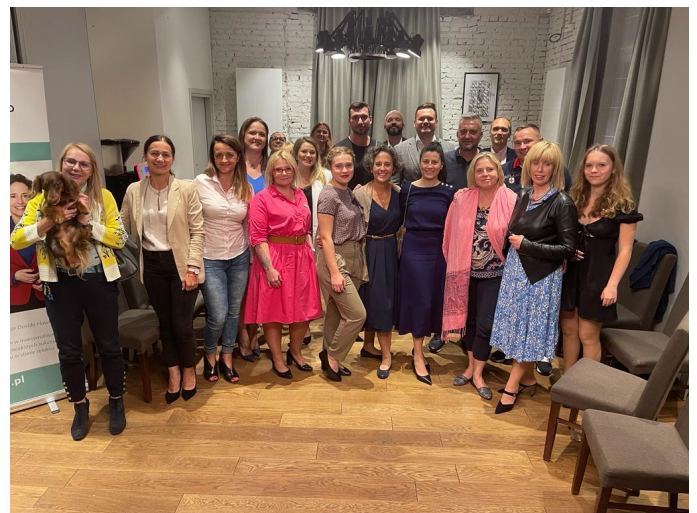
Zdjęcia z poprzedniego spotkania Klubu Radosnego Biznesu.